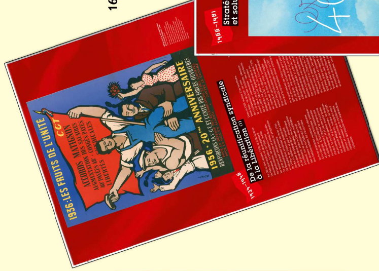
Exposition 16 panneaux - format 65 x 100 cm Plastifiée - 4 oeilllets Prix unitaire : 270 €uros