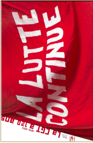
Affiche Format: 60 x 80 cm Prix unitaire : 8 €uros