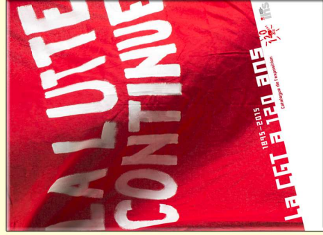
Catalogue de l'exposition 82 pages Prix unitaire : 15 €uros