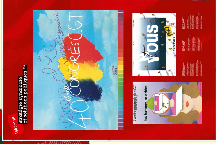
1948-1981 Stratégie syndicale et solutions politiques (3)